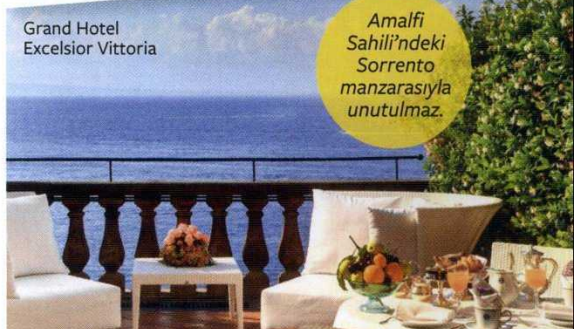
Grand Hotel Excelsior Vittoria

Amalfi Sahili'ndeki Sorrento manzarasıyla unutulmaz.